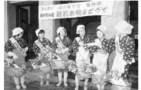
▲水仙娘出向宣伝 昭和46年 65546

写真の検索ページはこちらをクリック。 文書館HPトップ → 目録データベース → 写真