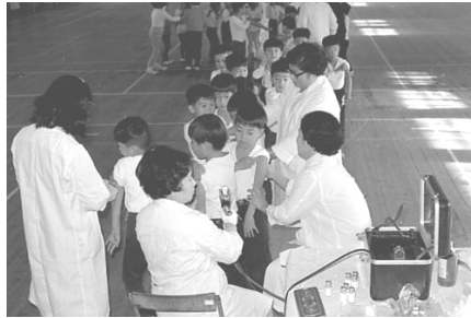
▲インフルエンザ予防注射 昭和44年 64265