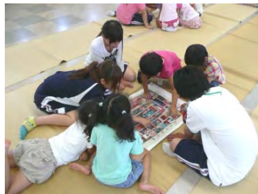
▲福井市内公民館での昔遊び体験の様子

従来のすごろくシート20点に加えて、新たに地図や絵図などの複製シート22点を作りました。学校や公民館を中心にシートの貸出しや出前講座を行っています。